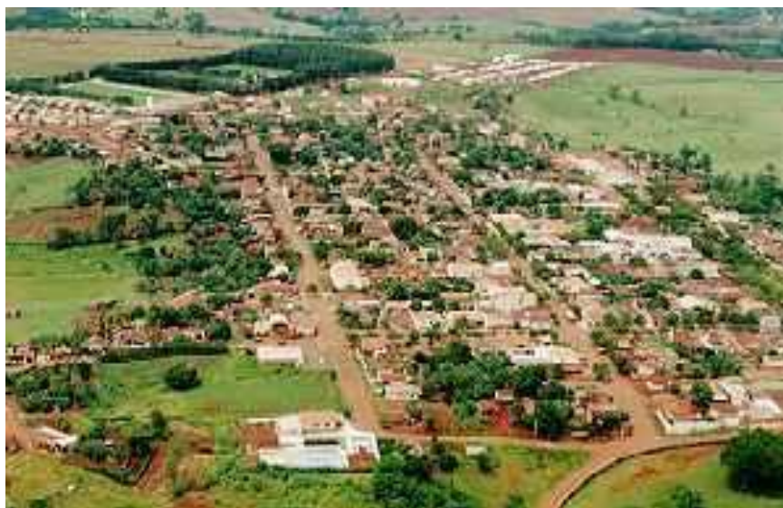
Imagem do município – Fonte SEDU – Paraná cidade