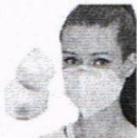
Kit 10 Máscara De Proteção Hospitalar Pff2 N95...