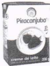
Creme de Leite Piracanjuba 200g