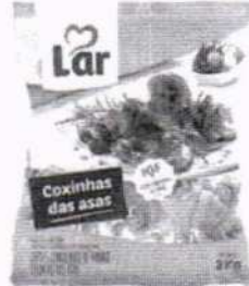
Coxa da Asa de Frango Lar 1kg