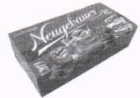
Bombom Neugebauer Hits 200g